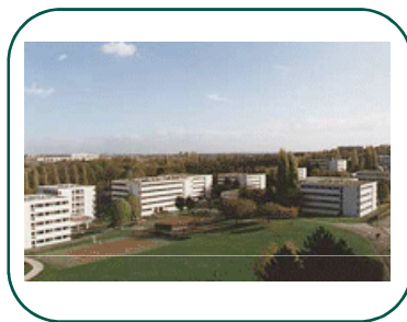
Centre d'Excellence de Biotechnologies blanches