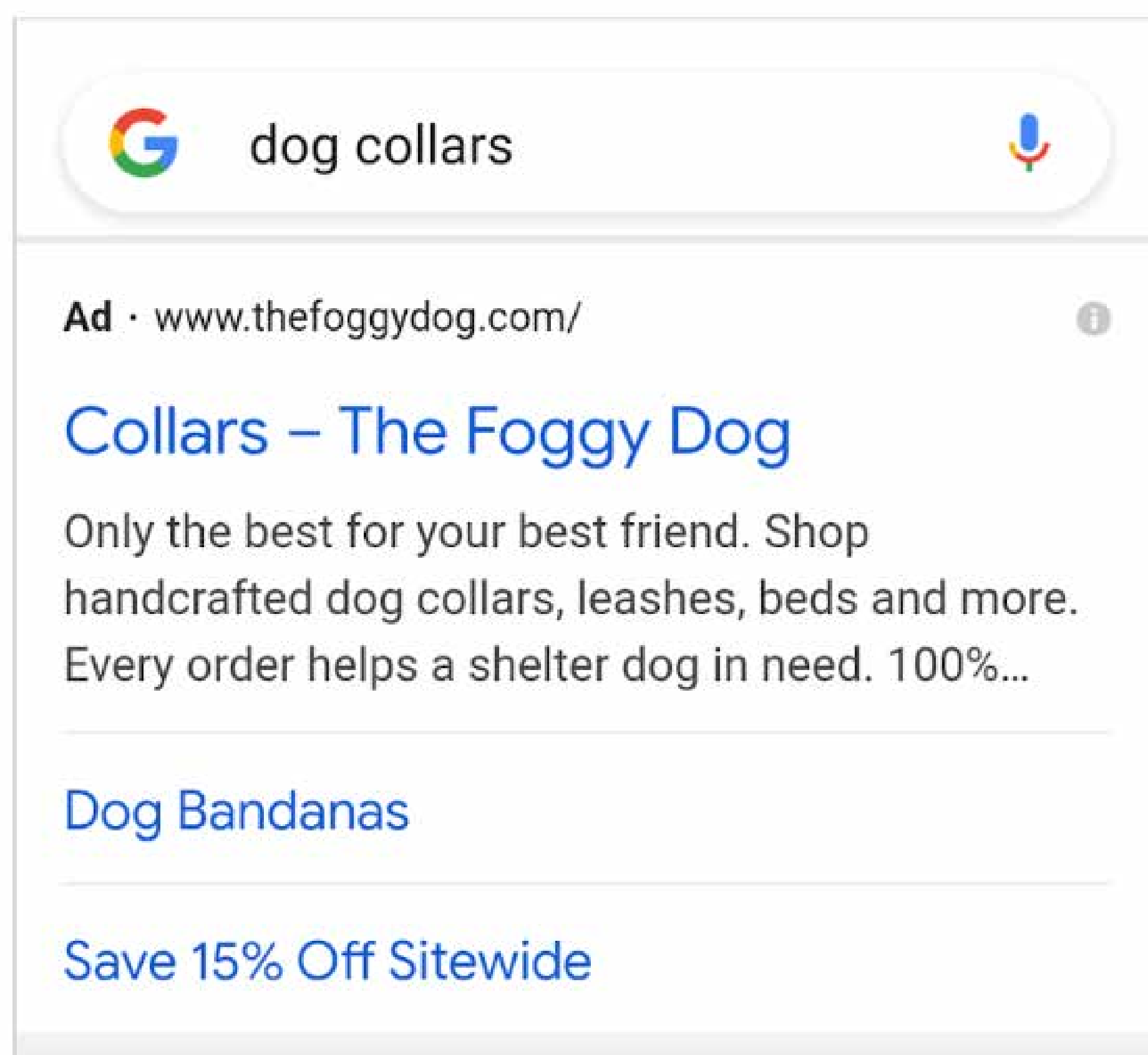
Exemple d'annonce apparaissant sur le réseau de recherche Google

1. Campagnes sur le réseau de recherche : Vous pouvez faire la promotion de votre entreprise sur un grand nombre de sites Google, mais nous vous recommandons de commencer par les campagnes sur le réseau de recherche . Ce type de campagne vous permet d'atteindre des prospects à fort potentiel en diffusant des annonces sur le vaste réseau de résultats de recherche de Google.