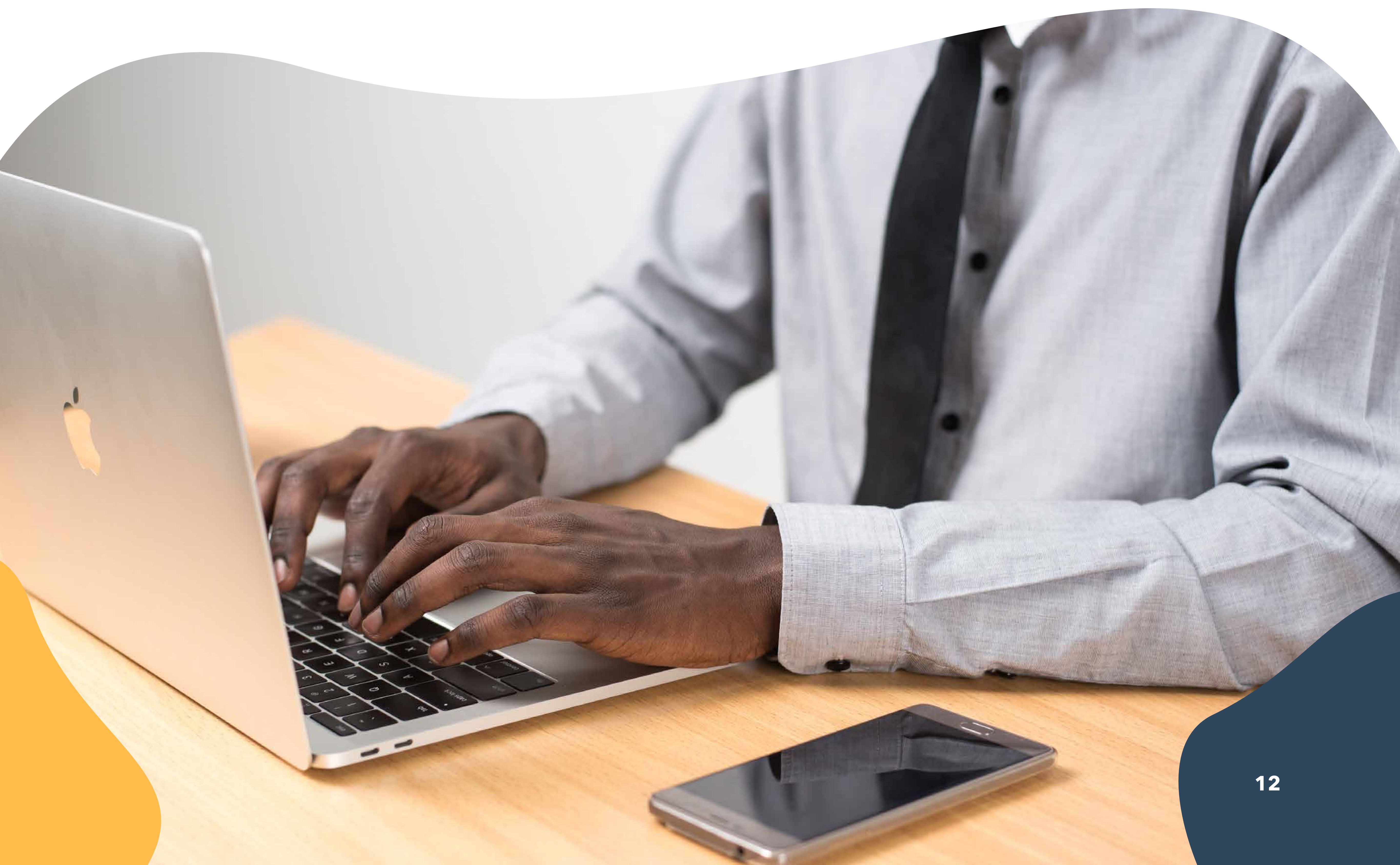
Illustration concrète des extensions d'appel