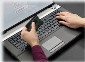
E-banking & paiement