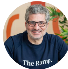
Co-fondateur de The Ramp

N'hésitez pas à nous contacter si vous souhaitez en savoir plus et échanger sur ces sujets.