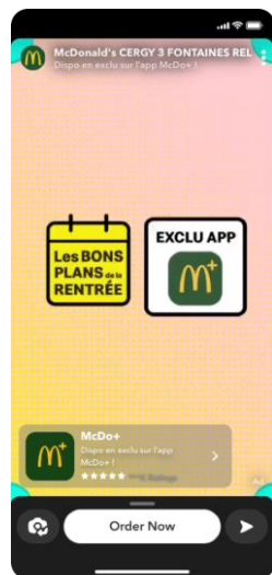
Snap Ads / CTA Téléchargement App

Les utilisateurs peuvent swiper vers le haut pour être redirigés directement vers une page de produit pour effectuer un achat.